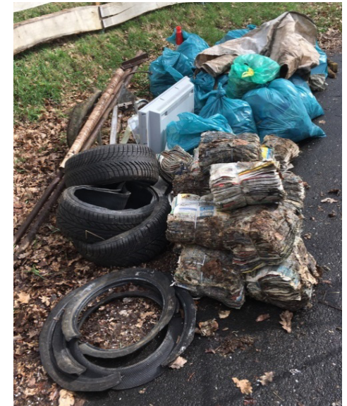
Was in nur drei Stunden alles so zusammenkommt ...