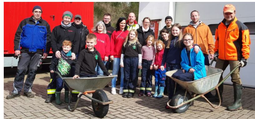
Fleißige Helferinnen und Helfer – bei aller Mühe kam auch die gemeinsame Freude nicht zu kurz!

Einen gemütlichen Ausklang fand die Aktion dann bei Kaffee und Kuchen wiederum im Feuerwehrhaus – Mühe muss schließlich auch belohnt werden. Der Ortsrat dankt allen, die zum Gelingen beigetragen haben – und fordert diejenigen auf, die für das Müllaufkommen gesorgt haben, sich gehörig zu schämen ...!