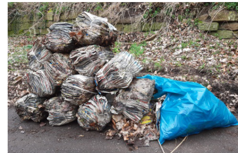
Wundern wir uns darüber, dass manchmal keine Werbezeitungen im Briefkasten liegen?

Einen gemütlichen Ausklang fand die Aktion dann bei Kaffee und Kuchen wiederum im Feuerwehrhaus – Mühe muss schließlich auch belohnt werden. Der Ortsrat dankt allen, die zum Gelingen beigetragen haben – und fordert diejenigen auf, die für das Müllaufkommen gesorgt haben, sich gehörig zu schämen ...!