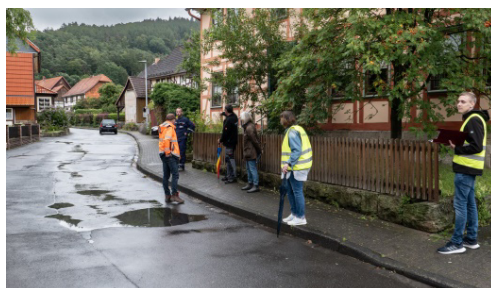
Für die Streckenführung der Buslinie durch die Leinweberstraße in Richtung Göttingen wird ein rechtsseitiges Halteverbot notwendig werden.