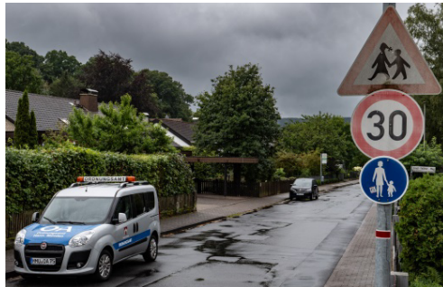
Bislang gilt Tempo 30 nur vor dem Kindergarten – der Ortsrat setzt sich für eine Tempo-30-Zone im gesamten Dorfbereich ein.

Der Ortsrat bedankt sich beim Fachdienst Sicherheit und Ordnung der Stadt Hann. Münden für den konstruktiven Begehungstermin.