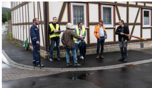
Ein intensives Thema war die Einmündung Sonnenstraße – Gimter Kirchweg für die Streckenführung der Buslinie 120 in Richtung Gimte / Hann. Münden.