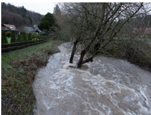
... und südlich vorbei an den Stegwiesen ...