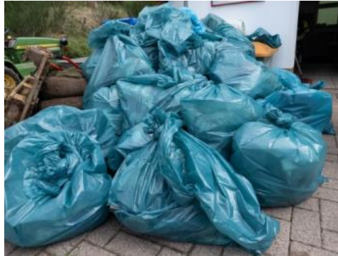
Was in nur drei Stunden alles so zusammenkommt ...

Am 6. April war es wieder an der Zeit: im Rahmen der stadtweiten Aktion „Münder putzt sich raus“ haben sich rund 60 Volkmarshäuserinnen und Volkmarshäuser aller Altersklassen zusammengefunden, um unser Dorf von all den Dingen zu befreien, die im Laufe des Jahres mehr oder weniger achtlos in unserer Umgebung entsorgt wurden. Pünktlich um 10 Uhr trafen wir uns am Feuerwehrhaus, um von dort aus in kleineren Trupps mit Schubkarren, Säcken und Müllzangen auszuschwärmen.