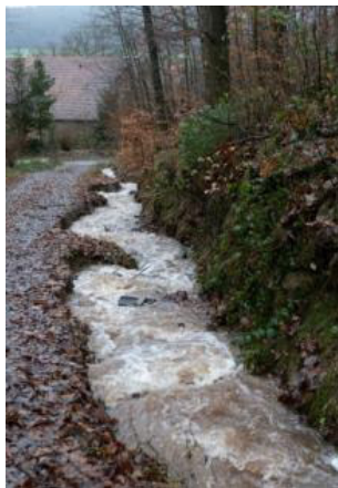
Zulauf aus dem Habichtgrund in Richtung des Eichhofs.