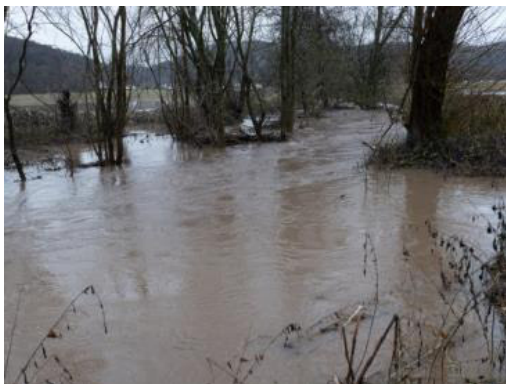
... bis kurz vor der Einmündung in die Weser, wo es ruhiger, aber auch breiter wird.