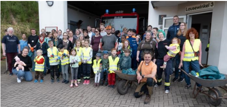
Fleißige Helferinnen und Helfer – bei aller Mühe kam auch die gemeinsame Freude nicht zu kurz!

Einen gemütlichen Ausklang fand die Aktion dann bei Kaffee und Kuchen wiederum im Feuerwehrhaus – Mühe muss schließlich auch belohnt werden. Der Ortsrat dankt allen, die zum Gelingen beigetragen haben – und fordert diejenigen auf, die für das Müllaufkommen gesorgt haben, sich gehörig zu schämen ...!