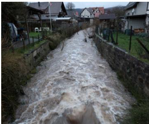
Die Schede am 25. Dezember 2023 im Bereich der Brücke am Rehthagen ...